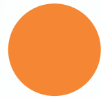
Tabela de cores

CMYK: 0-60-100-0 RGB: 245-134-52 Web: #F58634 Pantone: 1575 C